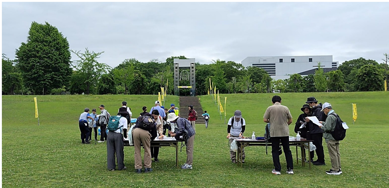
スタート風景① 7:00~10:00 科学の門が素敵ですね!!