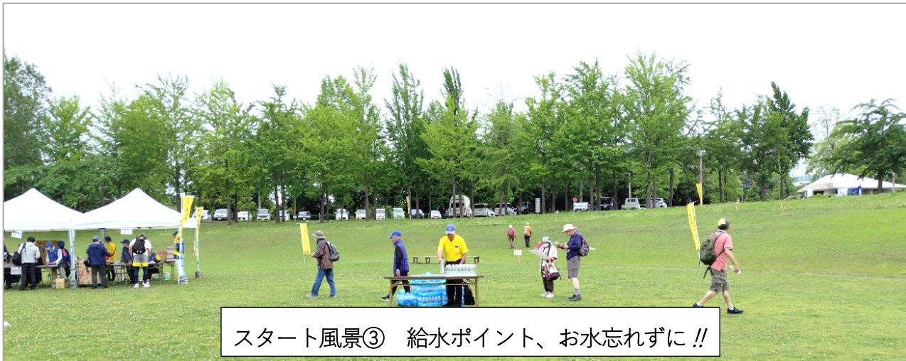
スタート風景③ 給水ポイント、お水忘れずに!!