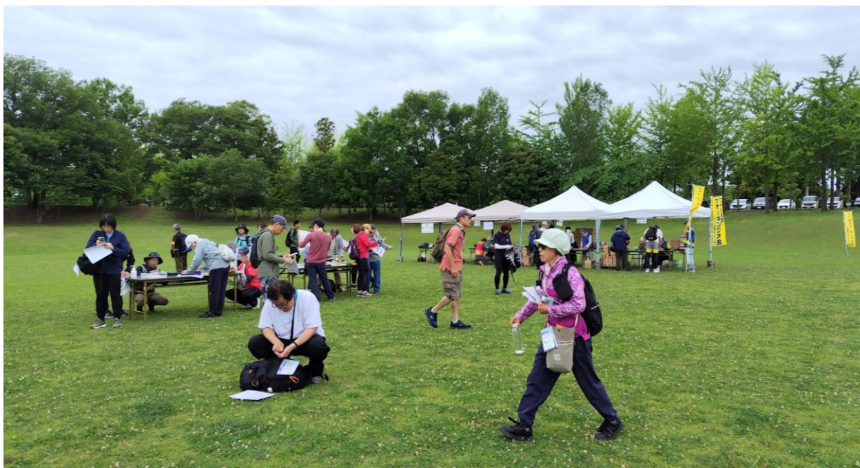
スタート風景② 7:00~10:00 出発準備に、余念がない参加者の皆さん。