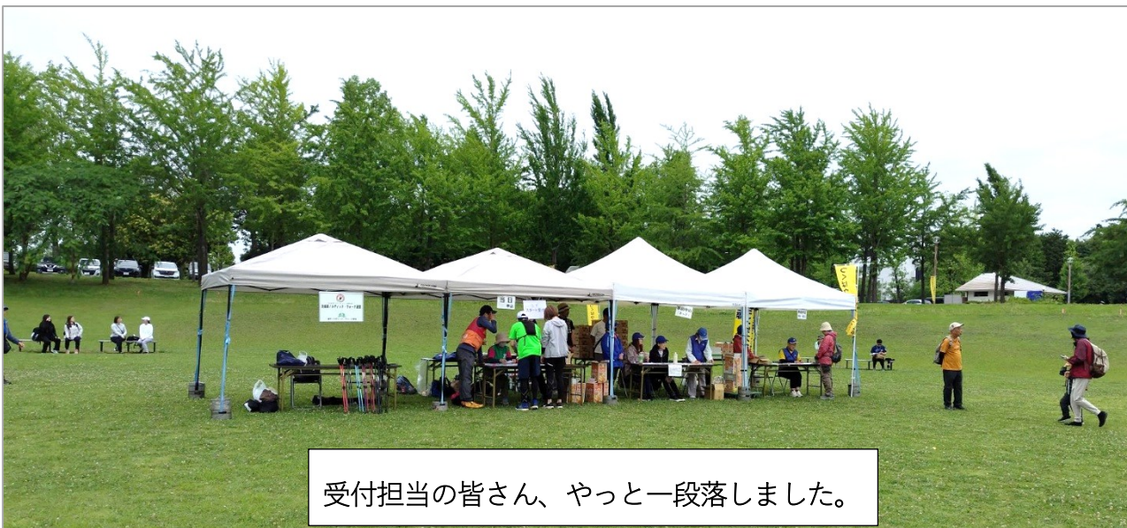
受付担当の皆さん、やっと一段落しました。