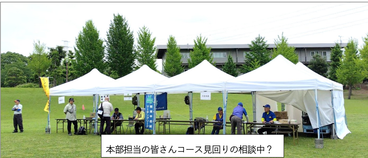
本部担当の皆さんコース見回りの相談中?