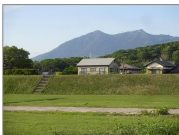
小田城跡(筑波山遠望)

長久寺の北東約 1 km に三村山清冷院極楽寺跡という中世律宗の廃寺跡があります。奈良西大寺の僧忍性は建長四年(1252)からこの寺に来往し、正嘉二年(1258)には堂宇を一新しました。この石灯籠は、その頃、上述の西大寺系の石工によって作成されたものと考えられています。