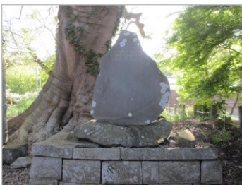
「藤原藤房卿跡」記念碑

亀城のシイ(スダジイ)は幹周7.4m、高さ16m、枝張最大20mあり、樹齢推定500年です。地上約1mの所で2つに分かれ、各径0.8mあります。樹勢は旺盛で、県下のシイでも有数の巨樹です。