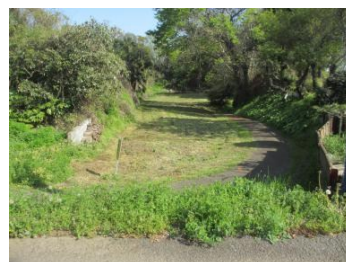
藤沢城址に残る「空堀」