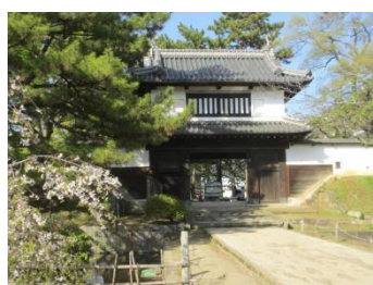
「土浦城址及び櫓門」