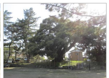
天然記念物「亀城のシイ」