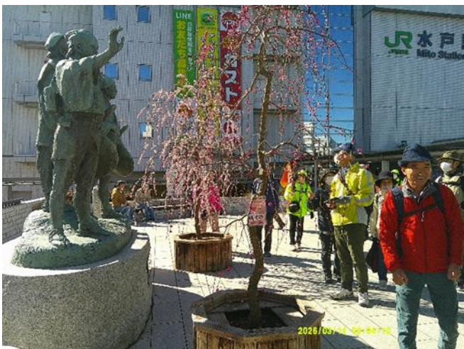
《水戸駅北口・黄門像と梅》

佐橋紅・白難波・江南所無・おもいのままが満開でした。東口から出て千波湖経由で会場に無事フィニッシュストレッチ後 IVV を配布して散会としました。参加者の皆様大変お疲れ様でした。