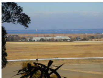
阿波崎城址より望む桜川集落と霞ヶ浦の遠景

また、大杉神社は、日本唯一の夢むすび大明神と言われ、正月や節分祭には多くの参拝客が訪れ、年間の参拝者は33万人を数えます。