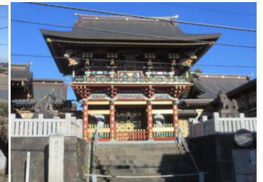
豪華絢爛な大杉神社の麒麟門