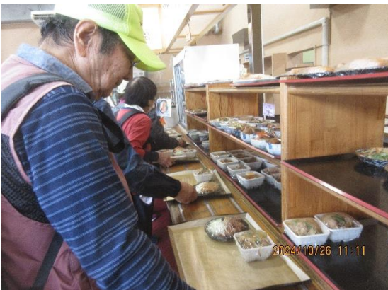
道の駅いたこ、何を食べようかな?