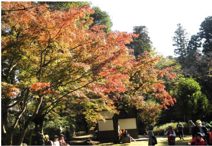
例年から比べると温暖化の影響で紅葉するのが遅いですね<<歴史館の銀杏>>