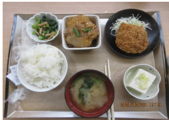
ボリューム感ありますね