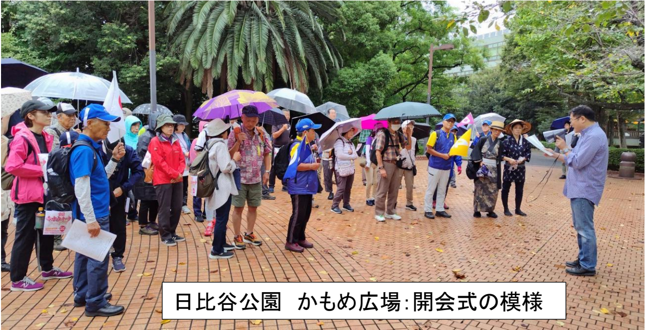
日比谷公園 かもめ広場:開会式の模様