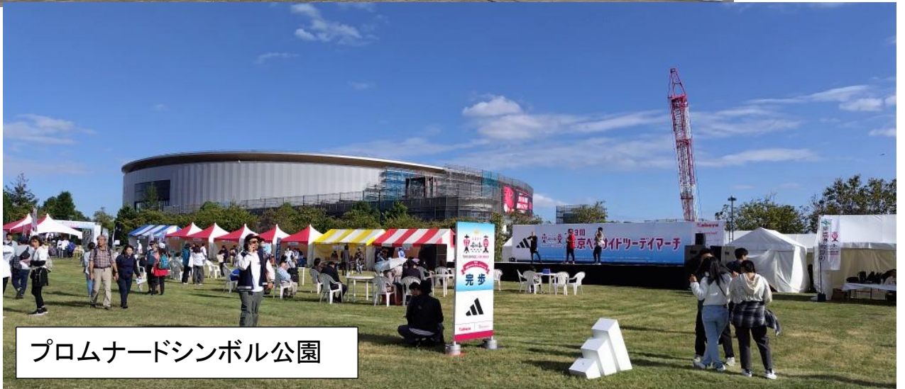
プロムナードシンボル公園

◆「投稿」のお願い 400~600 字程度 送付先 : 富田 里美 FAX : 0294-76-9520 Email:info@ibaraki-walking.jp ◆本誌の年間購読について 年間購読料 2000 円 (内訳:1部 30 円+送料他)郵便振替で送金して下さい。各種大会の「開催要項」なども同封致します。郵便また、振替口座記号番号 00110-8-374140 加入者名:茨城県ウオーキング協会