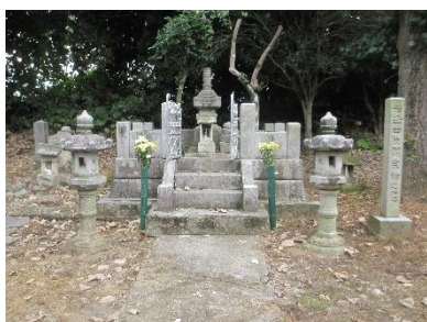
関城跡に建つ関宗祐の墓

関城跡には、この関宗祐、宗政父子の墓と伝えられる「宝篋印塔」があり、墓の南側には「史跡関城之碑」(明治三(1870)年建立)も有ります。この碑は、関宗祐と北畠親房の偉業を讃えています。