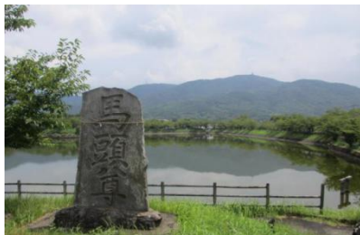
北条大池より宝篋山(小田山)を望む

平沢官衙の西方には、江戸の面影を残す「北条の街並み」が残っています。北条は、筑波山参詣道であるつくば道の門前町として、また、筑波山麓地域の商業の中心地として繁栄してきました。