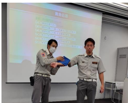
土浦消防署救急救命士の皆さん