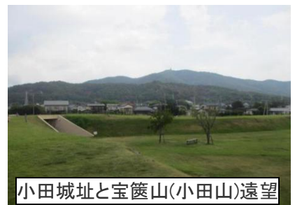
小田城址と宝篋山(小田山)遠望

かつては、筑波鉄道の線路が本丸の南東部から北西隅にかけて斜めに横切っていましたが、筑波鉄道廃線後に路線の跡地をりんりんロードとして整備する際、城跡を迂回するようコース変更し、路線跡を切通として残し、現在は土塁の断面展示を行っています。