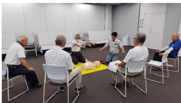
男女のグループ別にて救急救命実習