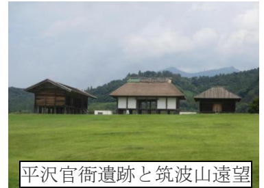
平沢官衙遺跡と筑波山遠望

この遺跡には、掘建柱建物跡が55棟、礎石建物基壇跡4基、大溝跡や柵列跡、竪穴建物跡25軒が発掘されています。つくば市では、この重要な文化財を後世に伝え、活用するために、平成9年度(1997)から6年間をかけて往時の姿を復元しました、