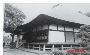
↑ 龍禅寺(三仏堂) 天慶2年 (939年)の創建、将門は三仏堂で 生まれたと伝えられている。