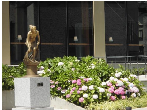
市民会館のあじさい

先週に引き続き、蒸し暑い中参加頂きありがとうございます。出発式の挨拶で「梅雨型熱中症」のサインについてお話をさせて頂きました。脱水症状ですが、のどの渇きよりは、疲労感・気分不快・食欲不振が先に出ることがあります。じとじとした汗をかいて・いつもより汗が乾きにくいと感じたら注意が必要湿度が高い環境では、のどの渇きに鈍感になりやすく、意識して水分補給することが大切です。(水戸市東部高齢者支援センターだよりより抜粋しました) 水戸駅北口より大通りの紫陽花を愛でながら水戸芸術館で休憩(水分補給)。水戸八幡宮で御涼所とあじさいの小径を60種 5000株のアジサイを愛でて茅の輪くぐりで安全祈願し、保和苑へと向かった。保和苑で昼食とアジサイ鑑賞西洋あじさいやがくあじさいが満開となり色鮮やかに咲き誇っていました。記念写真を撮り、保和苑下に向かい、観光漫遊バスで水戸駅に向かう参加者と分かれ湧水群のあじさいを鑑賞しながら歩いた。小澤の滝で小休止。参加者紹介水戸駅北口にほぼオンタイムで到着し散会しました