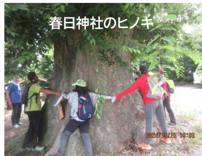
春日神社のヒノキ