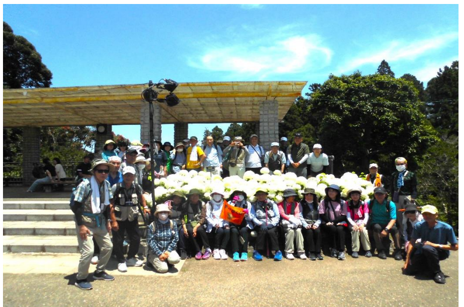
←八幡宮 茅の輪くぐり