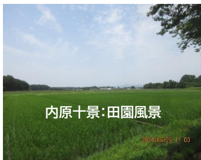
内原十景：田園風景