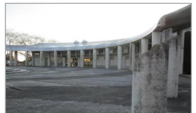
大串貝塚ふれあい公園 埋蔵文化財センター