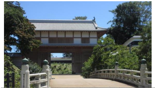
水戸城の大手門(土塁と空堀に架かる橋)

奈良時代に作られた「常陸国風土記」には、ダイダラボッチが貝を食べて捨てた場所として、ここ大串貝塚が比定地(大櫛之丘)として記載され、重要な遺跡となっています。