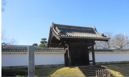
旧弘道館の正門と附塀(つきたりへい)

弘道館は、水戸藩第9代藩主徳川斉昭(裂公)が、改革を眼目として、天保12(1841)年に開設した日本最大規模の藩校です。水戸城三の丸の中に正庁をはじめ、文館・武館・医学館・寄宿寮等の他、調連場・矢場・砲術場等を設けました。明治戊辰の兵火と昭和20(1945)年の戦災で建物の多くは焼失し、現在は、四脚門の正門と土塀の中の正庁(正しくは『学校御門』:文武の試験や儀式を行う場所)・至善堂(藩主の休憩所、諸公子の勉学の場)・学生警鐘・要石碑が当時の建物等として残存するものの、神社・孔子廟・八卦堂等の大部分の建物は再建されたものです。幾度の戦火を免れた正庁、至善堂、正門 附 塀の建造