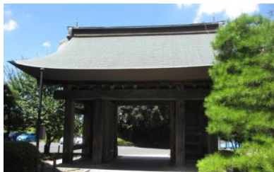
水戸城最古の建造物「薬医門」

水戸城の薬医門は、銅板葺に変更されているものの現存しており、現在は旧本丸にある茨城県立水戸第一高等学校・附属中学校に移築されています。この門は佐竹氏時代の建物と言われており、現存する水戸城の建物では最古のものです。