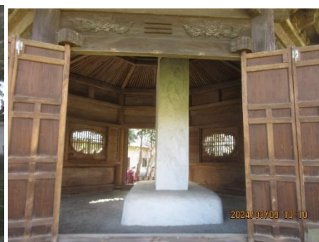
八卦堂（弘道館記碑）