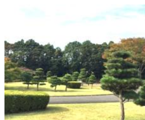
お手まき記念の森