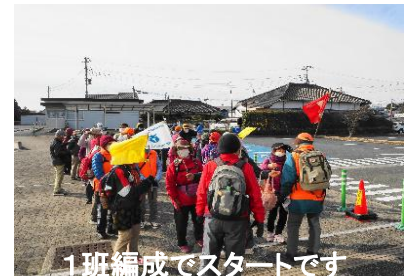
1班編成でスタートです

「松岡八景」は、文化年間(1804～1817)に、当時の領主中山信敬が儒学者 亀里亀章に場所を選ばせ 詩句をつけさせた処で、今回は六ヶ所を巡りました。42名の参加があり、盛会なウォーキングを楽しみました。また、最初の八景「能仁寺」では、住職ご夫妻より湯茶の接待をいただき、身も心もホットになりました。