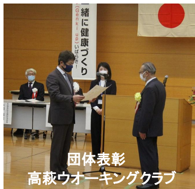
団体表彰 高萩ウォーキングクラブ

(※なお、当日はコロナ禍の関係で、表彰式への出席は県知事賞受賞者のみとなりました。)