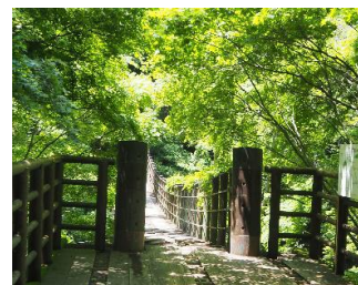
花貫溪谷 汐見滝吊り橋