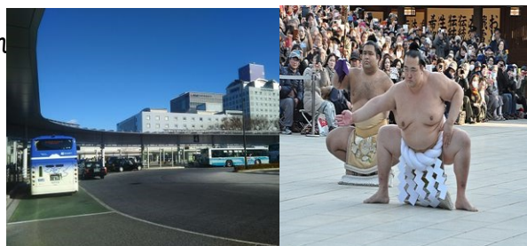
↑ ひたち野うしく駅

ひたち野うしく駅は、1985年(昭和60年)につくば市にて開催された、国際科学博覧会の臨時駅(万博中央駅)の跡地に1998年(平成10年)開業。駅周辺を開発をしていた都市整備公団(現UR)と牛久市が建設費を全額負担して開業された。西口には万博中央駅の記念碑があります。大相撲の二所ノ関部屋(元稀勢の里)が2022年駅東口から徒歩10分の所に開設。見学は外からの予定。新し街並みと周辺の公園などを散策します。