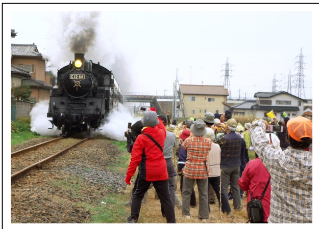
2012年11月11日 筑西市ウォーキングクラブ 連合会 「鮭の遡上と真岡線SL鑑賞ウォーク」 ウォーカーの見送りに機関士は煙を噴いて返礼 迫力満点で参加者大喜び