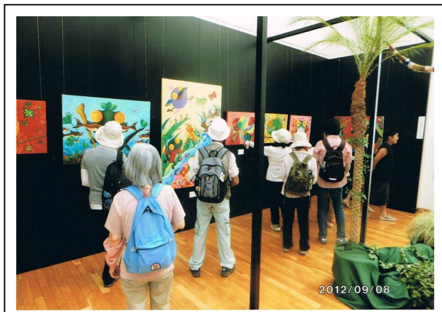
2012年9月8日 水戸歩く会 「偕楽園スズムシウォーク」 ウォーキング途中に芸術作品鑑賞