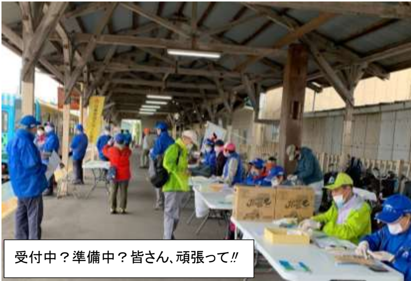
受付中?準備中?皆さん、頑張っ!!

茨城県内に4番目のウォーキングステーションが那珂湊駅に開設されました。駅直結のステーションは大変便利です。開設記念大会が、台風で延期10/17(土)開催となりました。冷たい雨にもめげず参加者40名弱スタッフ18名、日本市民スポーツ連盟から3名の方々から遠方より、お越し下さいました。「ひたちなか健歩の会」の皆様は開設まで、大変ご苦労されました。16時解散、参加者全員、完歩され記念大会が終了いたしました。風光明媚な3コース皆さんもドンドン利用して下さい。コロナウイルスに負けない身体作りをめざしましょう。