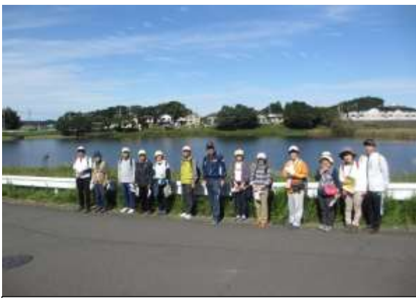
名平洞と青い空をバックに、ハイ整列!!

2020年10月18日(日)晴 那珂湊駅イヤラウンド開設記念大会 第2部(ナウマンの会様)