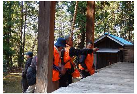
写真：参拝風景 左から 安良川八幡宮、丹生神社、朝香神社にて