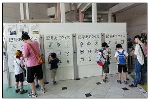
地理院・「測量の日」記念イベント風景

多数のご参加をお待ちしています！ コースはバラエティーに富んでいます 長距離コースあり、中距離コースあり ファミリーコースあり、歩測大会あり 国土地理院 OB の専門家が「マップ読みコース」を案内 します。子どもさんにはよい勉強になります。 また、国土地理院・地図と測量の科学館では6月7日 (日)に楽しい「測量の日」記念イベントが開催されま す。全国では珍しくなった歩測大会も同時開催、昨年は 歩測名人に女性第1号が誕生しました。 ※ウオーキング大会の募集要項が必要な方は、上記 記載のIWA 事務所までお問い合わせください。