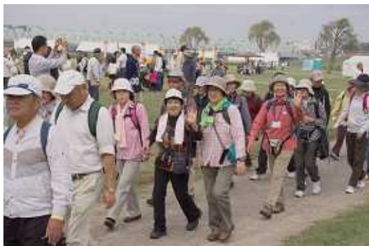
ニコニコ顔で出発するウォーカー(左)