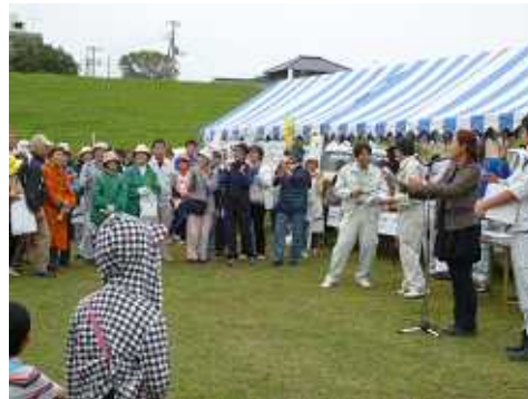
河川まつりの抽選会で当選番号を読上げる女性と聞き入る観衆達(右)